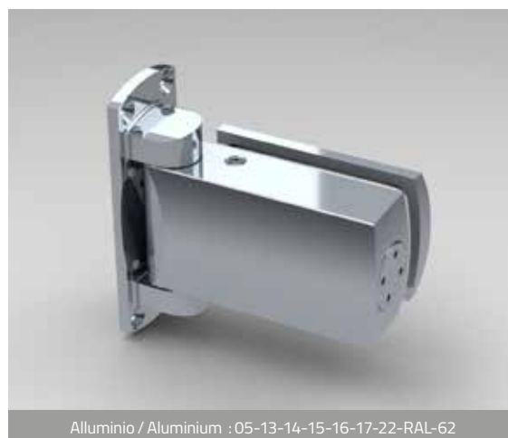
Alluminio / Aluminium : 05-13-14-15-16-17-22-RAL-62

APERTURE VIOLENTE OLTRE I 95° POTREBBERO CAUSARE LO SCARDINAMENTO. È CONSIGLIABILE L'APPLICAZIONE DI UN FERMAPORTA VIOLENT OPENING FURTHER THAN 95° COULD UNHINGE THE DOOR. WE SUGGEST TO INSTALL A DOOR STOP